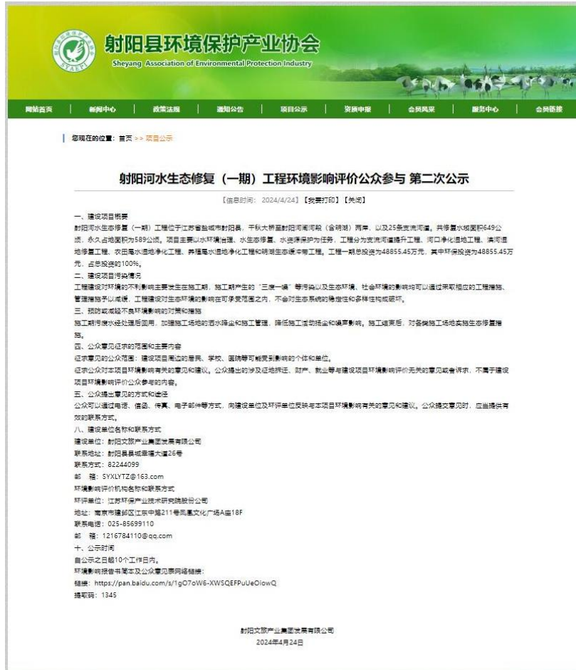
图 3-1 征求意见稿网上公示截图

2024年4月24日在射阳县环境保护产业协会网 ( http://www.syaepi.org.cn/epi/bst/20240424/009_8e5c65c5-665f-4ff1-837d-091b3774e6de.htm ) 对该项目环境影响评价进行了征求意见稿公示。征求意见稿网上公示截图见图 3-1。