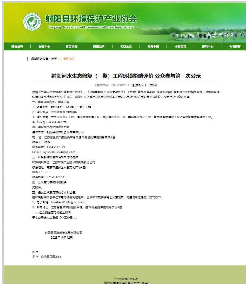
图 2-1 第一次网上公示截图