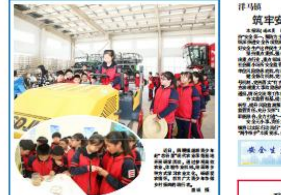
射阳县残联组织残疾人开展技能培训。

本报记者 姜永刚 通讯员 姜永刚 近年来,射阳县坚持以人民为中心的发展思想,高质量推动残疾人事业全面发展,让有爱小城更加温暖。 在就业方面,射阳县通过开发公益性岗位、提供技能培训等方式,帮助残疾人实现就业增收。在康复方面,县残联加大投入,提升康复服务水平,帮助残疾人改善身体状况。在扶贫方面,县残联落实各项优惠政策,帮助残疾人脱贫致富。 射阳县残联负责人表示,将继续坚持以人民为中心,不断提升残疾人生活水平,让残疾人共享改革发展成果,共同建设美好射阳。